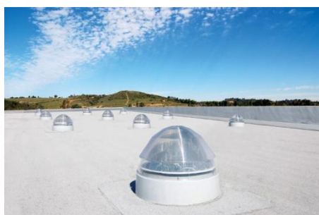
Solatube® Daylighting System