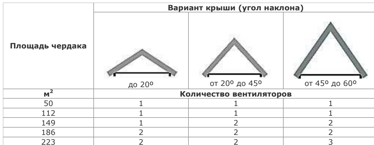
Таблица для подбора необходимого количества вентиляторов

Существует три вида профиля вентилятора Solar Star® :